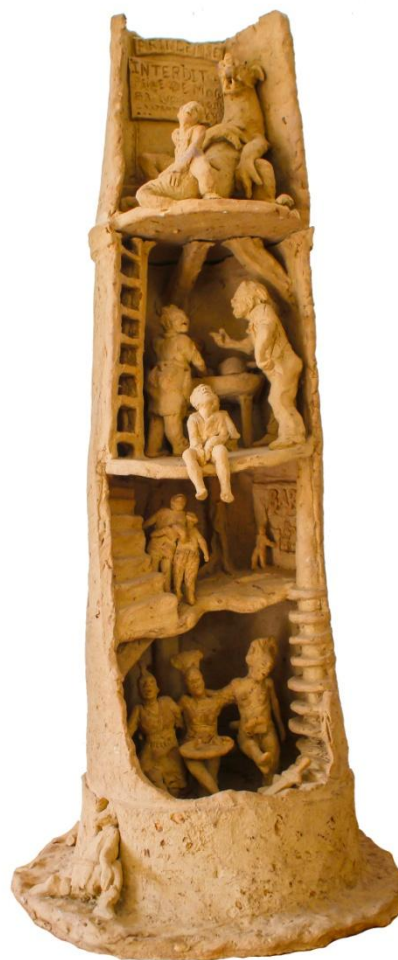
Tour de la désillusion

Elle crée ainsi avec maîtrise et justesse des croquis en 3D qui figent avec précision les attitudes, émotions, expressions de ses instants qui ont retenu son regard et qui ne manquent jamais de captiver le public.